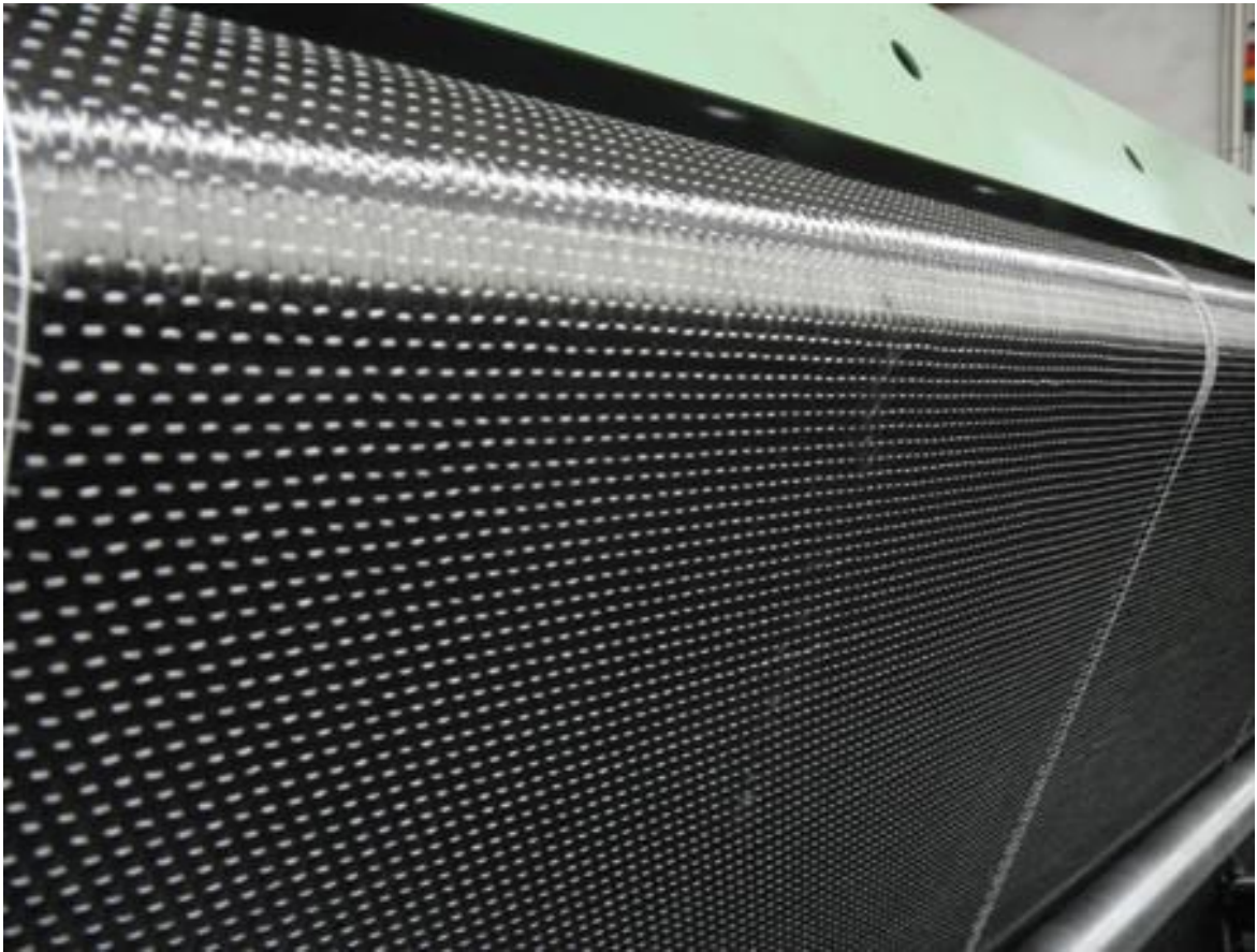
图示为该公司的设备织出的碳纤维单向布

我公司有产品开发试制车间，也有自己的中试车间。这保证了我们的技术不断提升。我们不但有设备制造技术，也有织物加工工艺技术。我们开发的设备，先在我们的中试车间验证，保证了我们所提供设备的技术成熟性。